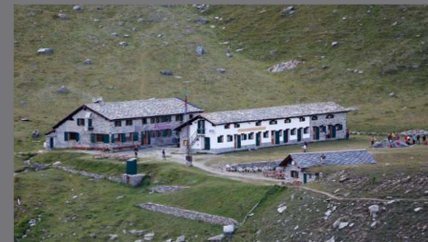
Rifugio Vittorio Sella