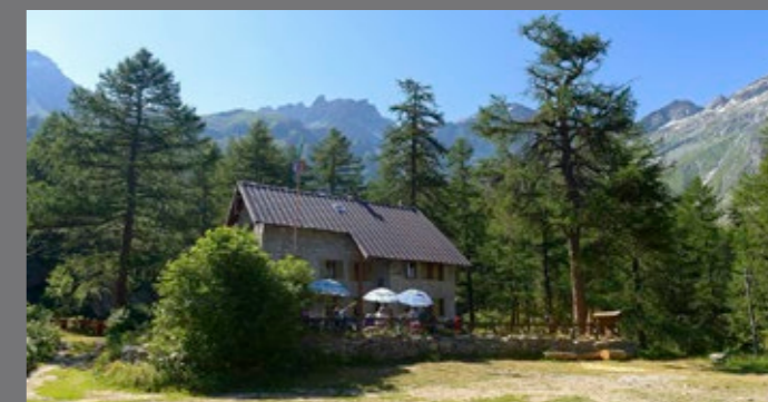
Rif. Levi-Molinari