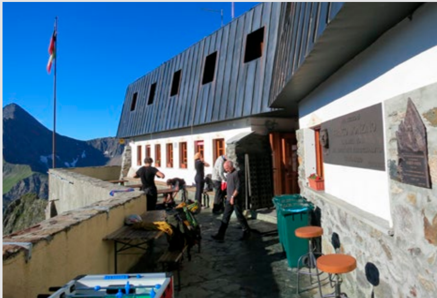
Rifugio Franco Monzino allo Châtelet, 2590 m (gruppo del Monte Bianco, Aosta)

Il grande potenziale sotteso al modus vivendi offerto da un gestore capace e appassionato consiste poi in un servizio intrinseco di utilità pubblica: attraverso un modello di vita intelligente e frugale per necessità, risulta essere un ottimo esempio pratico di educazione civica in direzione di una condotta rispettosa dell'ambiente e del fragile contesto montano, dove le ricadute negative di un contegno scorretto sono immediatamente evidenti sull'ecosistema e sull'uomo stesso. Il rifugista è infatti veicolo primario dei valori di sobrietà e senso della misura, di comportamenti verso l'ottimizzazione delle risorse e delle energie disponibili, del senso di responsabilità individuale di fronte alla "scuola" della montagna: precetti quanto mai necessari in questo specifico contesto, ma universalmente validi. Questo stesso modello di vita diventa un tutt'uno con l'edificio che lo ospita: rifugista e rifugio sono due entità inscindibili. La stratificazione data dall'uso plasma un rifugio funzionale ed efficiente, rendendolo simile per funzionalità e integrazione delle componenti a una barca a vela, dove tutto il necessario è configurato e ragionato per essere al posto giusto per essere governato al meglio dal timoniere. Il rifugista inoltre ha frequentemente delle forti motivazioni personali che lo portano a trasformare la sua attività in una vera e propria scelta di vita – come si può constatare