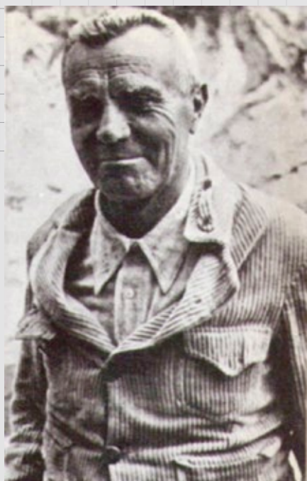
Tita Piaz (1879-1948)