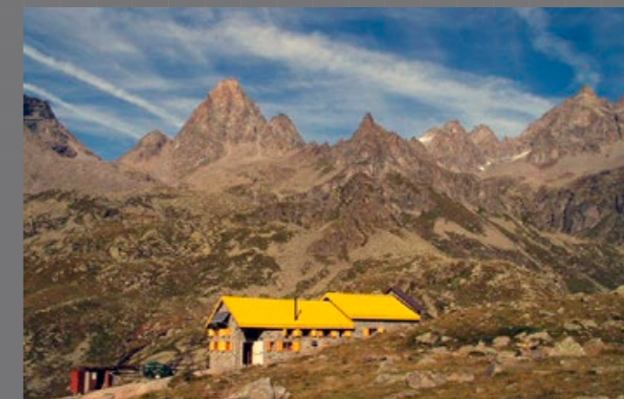
Rifugio Pontese