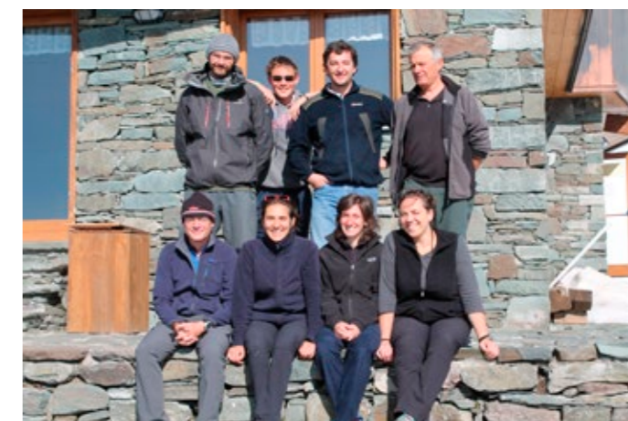
In queste pagine, scene di volontaria vita "gestionale" al rifugio degli Angeli in Valgrisenche, Aosta

alla solidarietà prestando servizio in una delle 12 strutture in Italia e, da poco, anche in quelle peruviane. La semplicità nell'accogliere il prossimo è fondamentale: un thermos sempre pieno per un bicchiere di tè caldo offerto non manca mai. C'è chi passa, chi si ferma a pranzo, chi cena e pernotta, chi arriva di notte per dormire un paio