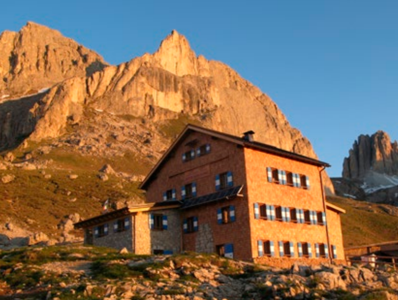
Il rifugio Roda di Vael