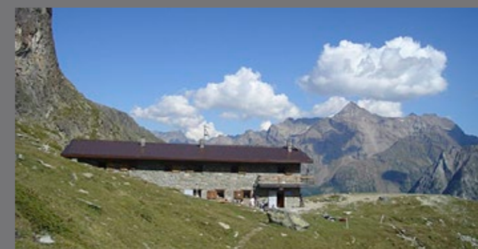
Rifugio Crête Sèche