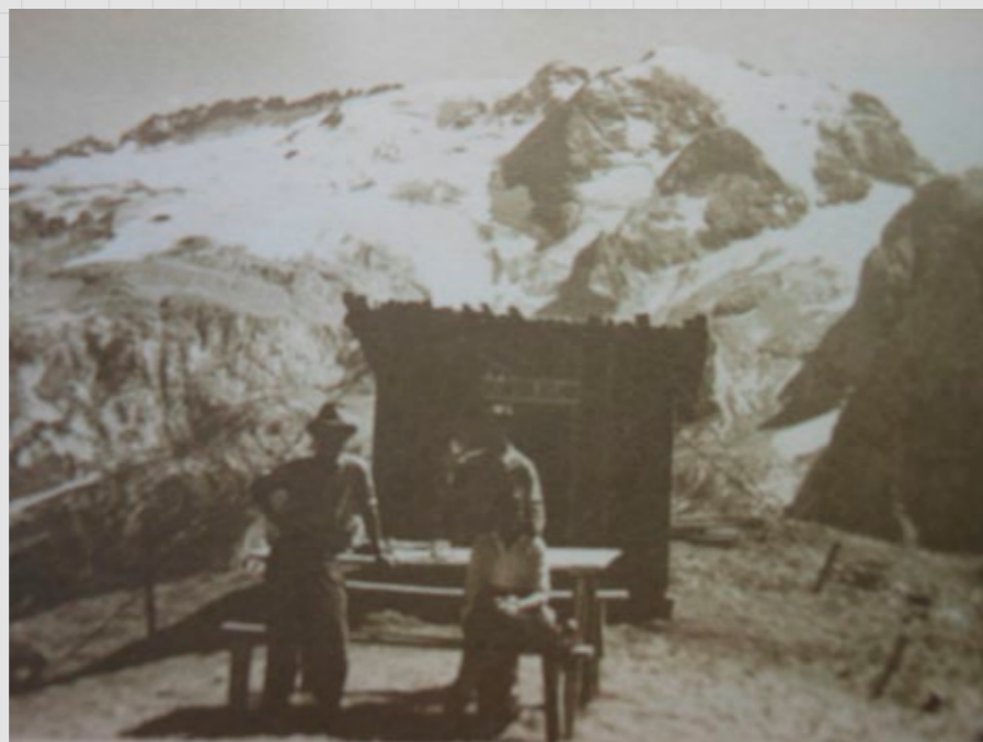
Il primo nucleo del rifugio Vièl dal Pan nel 1952