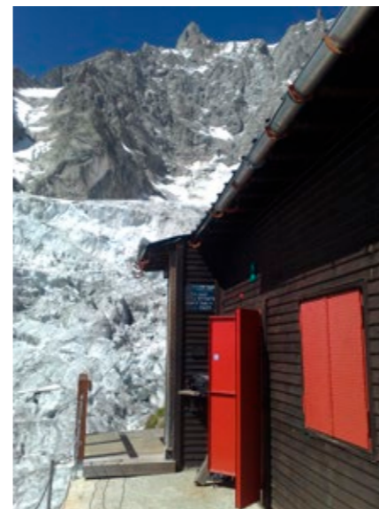
Il rifugio Boccalatte-Piolti